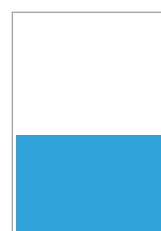
Media página 220 x 135 mm