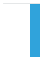
Columna 80 x 310 mm